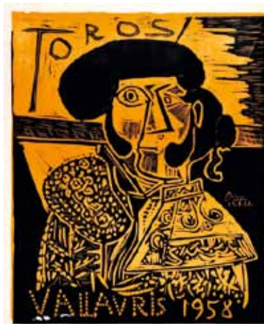
Pablo Picasso, Toros , Vallauris, 1958, affiche dédiée à Lucien Clergue, linogravure. Coll. Clergue.

Jusqu'au 4 janvier 2015, « De Clergue à Picasso », musée Réattu, 10, rue du Grand-Prieuré, 13200 Arles. Tél. : 04 90 49 31 14 et www.museereattu@ville-arles.fr