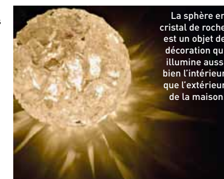
La sphère en cristal de roche est un objet de décoration qui illumine aussi bien l'intérieur que l'extérieur de la maison.

Denis Augé, tél. : 06 85 96 79 78 et www.dog-design.fr