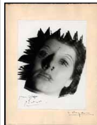
Lucien Clergue, Une amie , 1953, photographie d'inspiration surréaliste, tirage vintage de Picasso. Coll. Clergue.

en 1965 le premier département de photographies dans un musée français. Elle donne à découvrir une partie de sa collection qu'il a constituée au fil des années (ici près de 360 photos, héliogravures et documents). Événement majeur de la programmation, le photographe a accepté de prêter sa collection personnelle d'œuvres de Picasso afin de la présenter au public. Dessins originaux, gravures à la pointe sèche, à l'eau-forte, à l'aquatinte, linogravures et documents variés sont dévoilés en parallèle, imageant non seulement l'extraordinaire virtuosité du maître, mais aussi la relation profonde qu'il noua avec Lucien Clergue durant toutes ces années.